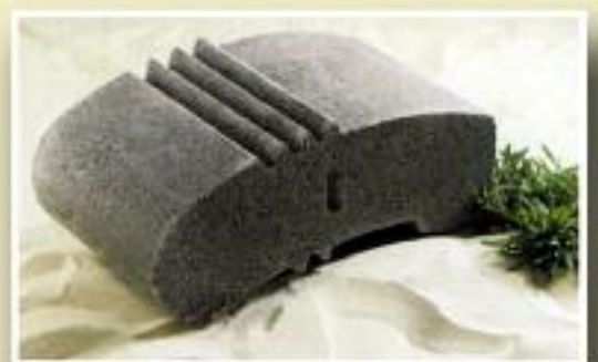
ELEMENTO MURO FIORITO cm 25x45 sp. 14 kg. 30